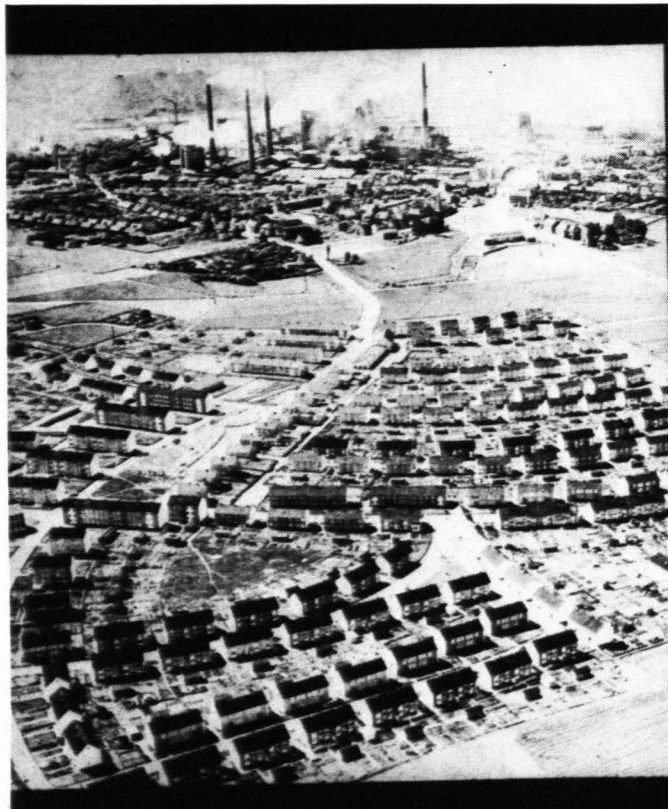
1 Siedlungsbild aus den 50er Jahren. Der Massenwohnungsbau (Mietwohnungsbau) wurde dem Eigenheim formal angeglichen (Beispiel: Aalen/Westfalen)