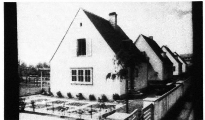
2 Eigenheim als bestimmendes architektonisches Leitbild (Beispiele aus den 30er Jahren [Dresden] und den 50er Jahren [Essen])