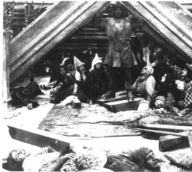
Abb. 2: Paul Wegener, Der Golem (D 1920).

In der Erzählzeit des Romans umfasst dieser Prozess bereits mehrere Jahrhunderte; für die Menschheit muss man wohl eine weitaus größere Zeitspanne einsetzen. Es sei denn, das Wetter änderte sich schlagartig im Sinne einer Zeit, die Benjamin in den Geschichtsthesen für den Messias reserviert wissen will, wenn es am Ende der These B heißt: »Den Juden wurde die Zukunft aber darum doch nicht zur homogenen und leeren Zeit. Denn in ihr war jede Sekunde die kleine Pforte, durch die der Messias treten konnte.« 47