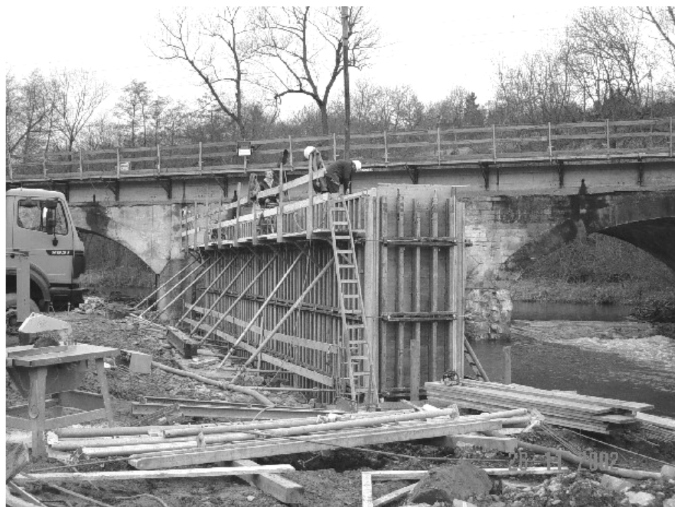
Bild 2 50% Helmtragepflicht an der gesicherten Arbeitstelle durchgesetzt, aber die allgemeine Ordnung reicht nicht aus

Absturz verhindernde Maßnahmen an den Brückenbauwerken waren der Schwerpunkt bei der Beratung vor Ort, wobei oft in gemeinsamen Vor-Ort-Beratungen die erforderlichen Lösungen „erstritten“ wurden. Dazu sind die Unsicherheitsfaktoren „Verhaltensweisen von alt-erfahrenen Kollegen“ und die Bequemlichkeit mancher Mitarbeiter häufig nicht zu unterschätzen.