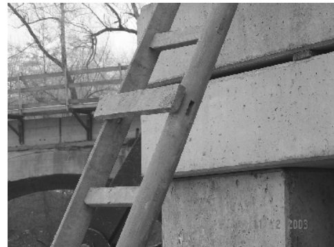
Bild 5 Selbsthilfe eines Mitarbeiters bis zur nächsten Sicherheitsbegehung durch Bauleiter und SiGe Koordinator