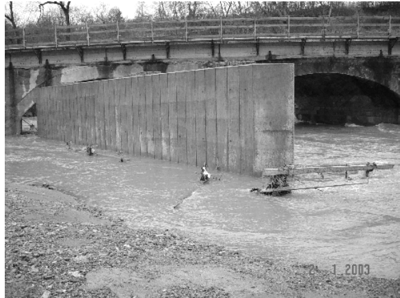
Bild 4 Hochwassersituation zum Jahreswechsel; Überflutung des Baubereiches einer Gera-brücke, den Zugang zur Fundamentgrube von Land gibt es nicht mehr.