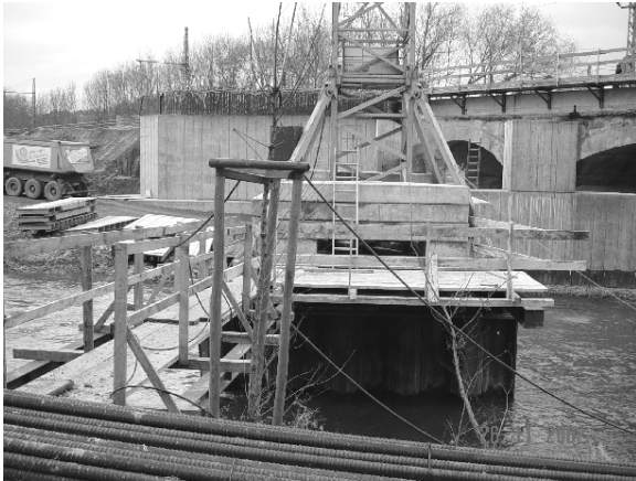
Bild 3 Ein ordnungsgemäßer Kranaufstieg ist vorhanden; den Zugang hat sich der Kranfahrer durch Material selber verbaut