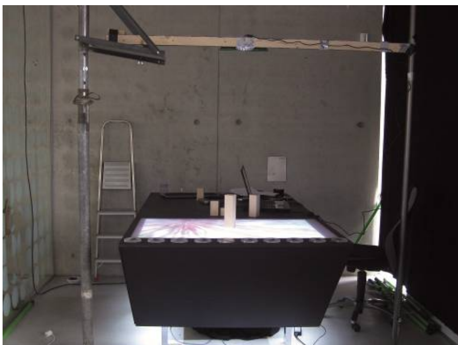
Abb. 1: Versuchsaufbau

Eine aktuelle, preisgünstige Alternative zu Laserscannern bietet der Kinect Sensor von Microsoft (Microsoft Deutschland GmbH). Kinect ist ein neuartiger Controller für die Spielekonsole Xbox 360, mit dem ein Spieler allein durch Körperbewegung und über Gesten ein Spiel kontrollieren und bedienen kann. Der Kinect Sensor verfügt über eine RGB-Kamera, einen Tiefensensor und ein Mikrofon, die Ganzkörper-, Bewegungs-, Tiefen-, Gesichts-, Gesten- und Spracherkennung erlauben. Im Rahmen dieses Projekts wurde der Kinect Sensor zur Tiefen- und Objekterkennung eingesetzt und über einen USB-Port an den Laptop angeschlossen, von dem die Sensordaten ausgewertet, verarbeitet und anschließend grafisch über den Beamer ausgegeben wurden. Ein Versuchsaufbau ist in Abbildung 1 zu sehen. Im Setup wurde die Kinect über dem Touch Table angebracht.