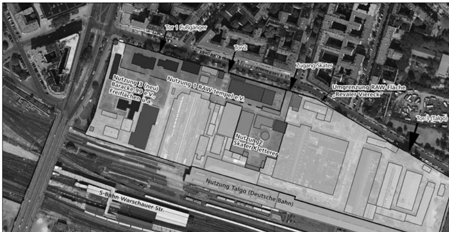
Abb. 1: RAW-Nutzungen bis 2007; helle Bereiche ohne Nutzungen

unterschiedlichen Geschwindigkeiten nebeneinander her und haben konträre Perspektiven hinsichtlich ihrer Dauerhaftigkeit am einem Ort.