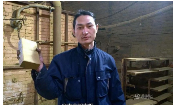
Abb. 3 Project Dust

Vor gehtens weise jedoch auch eine Ironie, die zur Problematisierung und Bekämpfung anthropogener Umweltzerstörung beiträgt. Im Gegensatz zu Verfechter*innender Theses des „guten Anthropozäns“ (Bennett et al. 2016), die auf technologiebasierte Innovationen und Entwicklungen zur ‚Behebung‘ des Anthropozäns setzen, greift Nut Brother zu einfachen Mitteln wie dem Staubsauger, um Luftverschmutzung zu dokumentieren. Nut Brother scheint dem fortschrittsorientierten Rahmen des ‚guten‘ Anthropozäns ein wenig Wind aus den Segeln zuzulassen, was die Hoffnung auf Besserung und gegebenenfalls auch Bewältigung anthropogen verursachter Umweltkatastrophen etwas zu dämpfen.