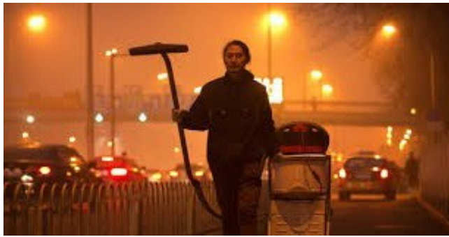
Abb. 2 Project Dust