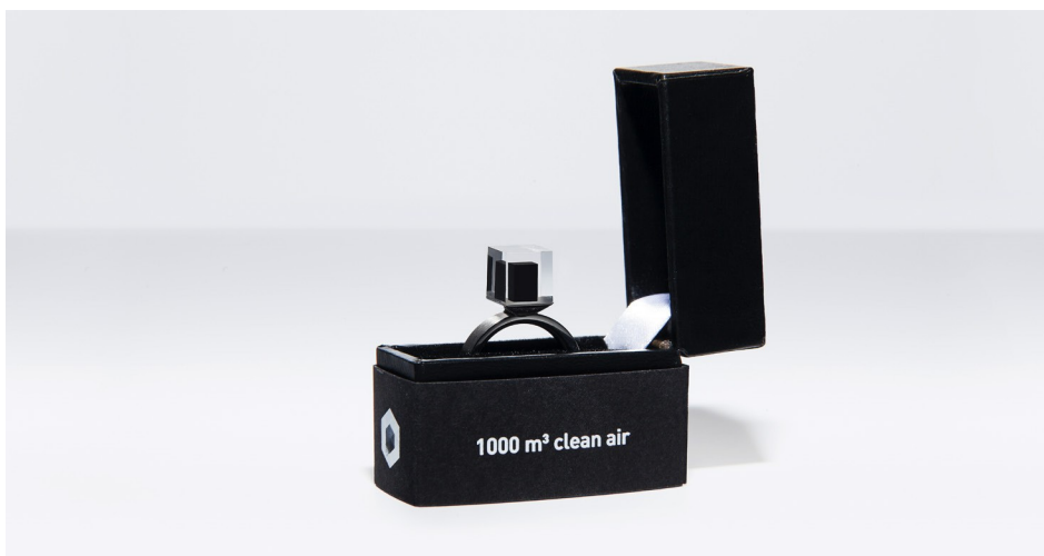
Abb. 4 „Smog-Free“-Ring

Weiterhin präsentiert Roosegaard sein Werk als lokale „Lösung für das Problem anthropogener Luftverschmutzung“ und es wird auch in Zeitschriften (Schlick 2019) und in Architektur und Design Diskursen als Lösungsbringer beschrieben. [15] Hier scheint Roosegaards (implizite) Sympathie mit dem ‚guten‘ Anthropozän durch. Saubere Luft wird als erstrebenswertes Gut positioniert und mithilfe der ‚richtigen‘ technologischen Innovationen aus